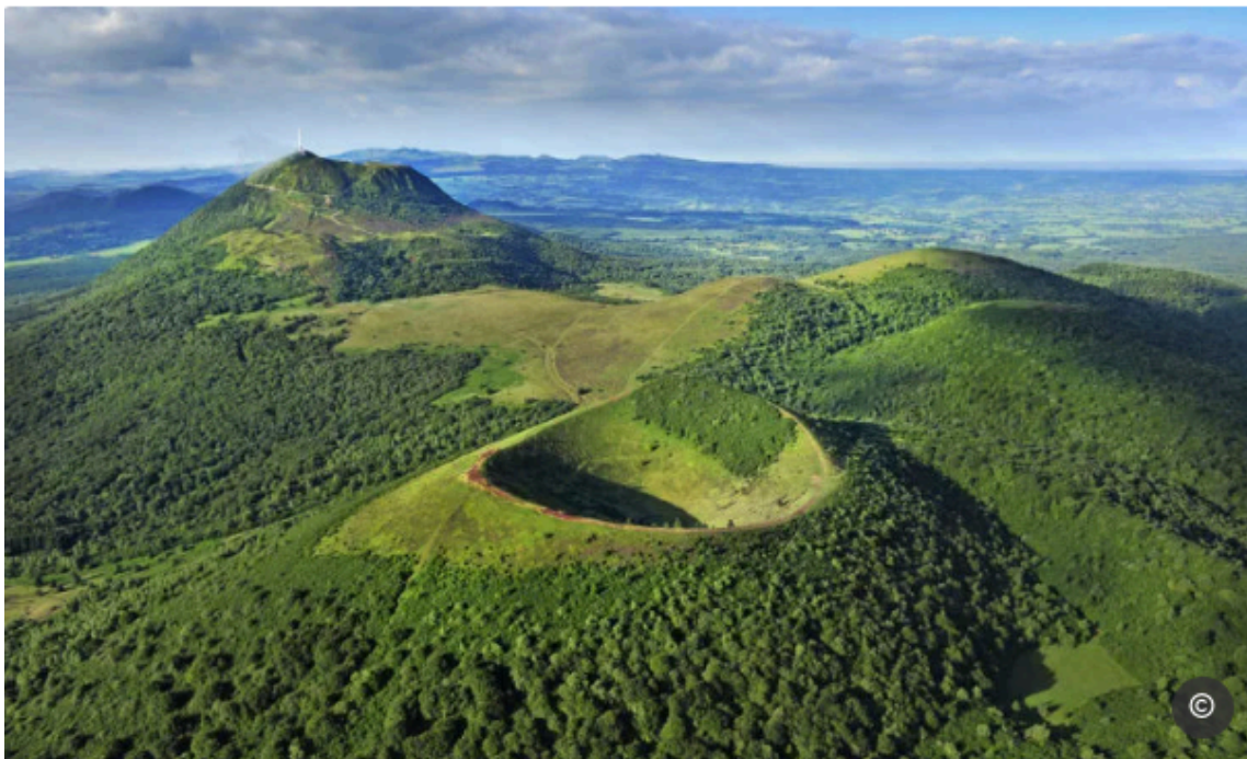
Photo des Volcans d'Auvergne

C'est en effet l'une des pierres les plus jeunes, si on la compare à la pierre calcaire de Vilhonneur par exemple qui date du Jurassique moyen entre environ -173,5 et -161,3 millions d'années (selon Harland & al.). Et pourtant elle reste une pierre puissante de par son origine : la pierre de Volvic provient du cratère de la Nugère au cœur du parc des volcans d'Auvergne, sa densité est égale à la pierre de Vilhonneur : 2,3 t/m 3 , sa résistance à la compression est en moyenne de 62Mpa là où la Vilhonneur est entre 45 et 65Mpa. La pierre de lave est réputée pour être dure, plus que le calcaire, mais on voit ici que tout dépend de quel calcaire nous parlons. La Volvic comme la Vilhonneur sont des pierres agréables et intéressantes à travailler, car elles offrent de nombreuses possibilités de traitement de textures grâce à leur dureté. La particularité de la Volvic est qu'elle permet, de par sa nature, d'être émaillée car elle possède une très bonne résistance à la chaleur.